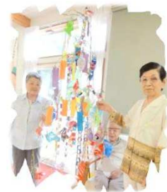
みんなで笹に飾りつけ〜♥

観測史上初の6月に梅雨明け宣言が出て以来、連日猛暑が続いています。7月は暑さを避けて室内での活動が増えました。七夕の飾りつけや浴衣の着付け企画などを実施いたしました。8月も暑さは続きますので、室内企画の「ゆめみの夏祭り」などを予定しております。8月も皆様方におかれましては暑さに負けず元気にお越しください♪