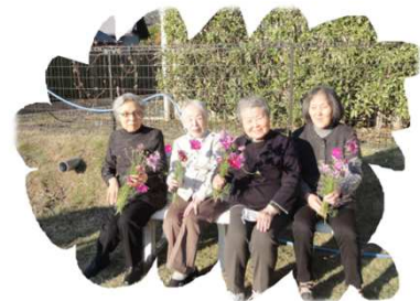
コスモス摘みで記念撮影♥

秋も深まり朝晩の寒さが増してきました。特に11月後半は霜が降りたり急に冬の顔を見せ始めました。そのような中11月は恒例の外食企画など、室内アクティビティを中心にお過ごしいただきました。12月はクリスマス会や年納め餅つき大会などの企画を用意し、皆様の生活機能の維持・向上を目的に各種企画を進めていきたいと思っております。