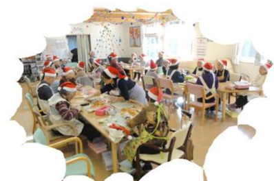
以前のクリスマス会の様子

年末年始は、12/31から1/5まで休業いたします。新年は1/6より営業開始いたします。何卒ご了承下さる様お願いいたします。