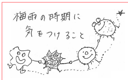
看護師さんの手描きイラスト♪

5月の連休が終わった途端、季節が進みました。初夏の空気が気持ちよくそよいでいます。利用者様も子供の日行事や庭の花摘みなど賑やかに忙しく過ごしていただきました。6月は季節が進み、暑くなる日も増えてくるので、水分補給をしっかりと、体を動かしていきたいと思います。みなさん元気にお越しください！