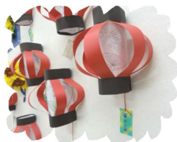
みんなで作った提灯♪

今年の8月は、観測史上最多の猛暑日という事でしたが、8月後半になると大雨が続いたり、目まぐるしい月でした。8月は暑さや雨を避け、体調を整えるため、室内でお過ごし頂く時間を多くとりました。それでも毎年恒例の夏祭りを開催して、にぎやかにお過ごし頂きました。9月は毎年恒例の敬老会を企画しています。皆様のご参加をお待ちしております。