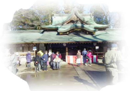
一言主神社へ初詣に行きました♥

1月に入ると厳しい寒さが続きました。ご利用者の皆さまは寒さに負けず元気にお越しいただき、様々な企画にご参加いただきました。1月13日と15日に一言主神社(常総市)と回転寿司の企画を2回実施いたしました。またインドアでは、いつもより体を動かすアクティビティ、レクレーションを重点的に行ないました。2月も寒さが続くと思われるので、引き続き皆さまの生活機能の維持・向上に努めてゆきます。