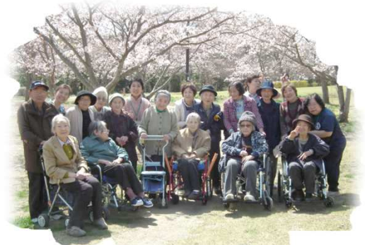
みんなでお花見に行きました♥

4月は、暖かな日はお花見やお散歩を積極的に実施しました。5月も体を動かすのには最適な季節ですので、外出や各種アクティビティを企画して、生活機能の維持・向上に努めてゆきたいと思います。