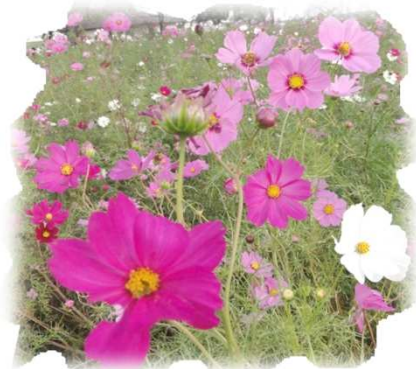
お出かけで行った公園はコスモスが満開でした♥

10月は、初旬は夏の様な暑さが続きましたが、後半は肌寒くなってきて、寒暖の差が大きい月でした。11月になると秋もますます深まってくるかと思えます。また、風邪が流行り始める時期ですので、体調管理にはご注意くださいようお願いいたします。 「ゆめみの」スタッフ一同も、ご利用者の皆さんに負けないう、元気に過ごしてゆきたいと思えます。