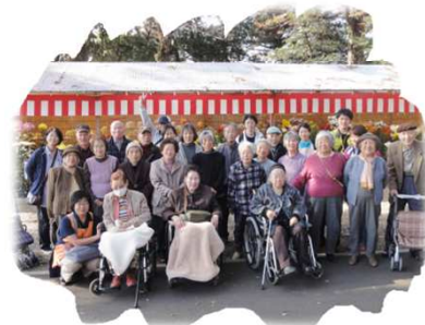
一言主神社へおでかけ♥

11月に入って秋も深まり、朝晩の寒さが増してきました。11月は「秋の企画」として、2年ぶりに一言主神社(常総市)へのお出かけを実施しました。また寒さが厳しくなってきましたので、室内での企画も増やしました。12月はクリスマス会や年納め餅つき大会などの企画を用意し、皆様の生活機能の維持・向上を目的に各種企画を進めていきたいと思っております。